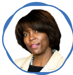
Ambassadrice Ertharin Cousin Vice-Présidente (USA)